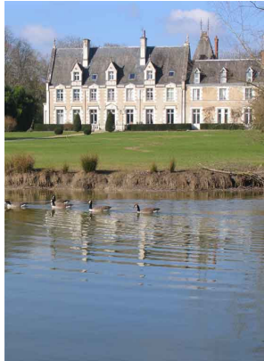
Le Domaine de Seillac

A 18 km de Blois, 10 km de Chaumont sur Loire, en pleine nature dans un parc de 24 hectares, notre château avec ses 17 chambres et ses salles à manger, ses 60 chalets, la piscine et son bassin enfants (ouverte et chauffée de Juin à Septembre), le tennis, l'aire de jeux pour enfants, les plateaux sportifs se répartissent dans la belle forêt et autour du plan d'eau de 4 hectares.