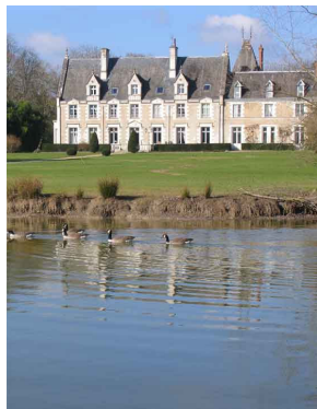
Le Domaine de Seillac

A 18 km de Blois, 10 km de Chaumont sur Loire, en pleine nature dans un parc de 24 hectares, notre chateau avec ses 17 chambres et ses salles à manger, ses 60 chalets, la piscine et son bassin enfants (ouverte et chauffée de Juin à Septembre), le tennis, l'aire de jeux pour enfants, les plateaux sportifs se répartissent dans la belle forêt et autour du plan d'eau de 4 hectares.